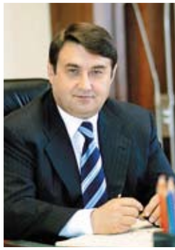
Министр транспорта Российской Федерации И. Левитин