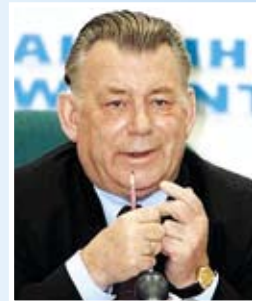
Г.И. Райков, Член Комитета по безопасности Государственной Думы Федерального Собрания Российской Федерации, Председатель Межфракционного депутатского объединения «Авиация и космонавтика России», Заслуженный изобретатель СССР

Хочу пожелать вам в полной мере реализовать стоящие перед клубом и ассоциацией задачи. Успехов вам в профессиональной деятельности и личного счастья. Уверен, что наше сотрудничество будет крепнуть и развиваться.